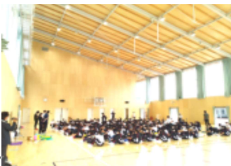
松島自然の家は旧東松島市立宮戸小学校跡地に新設されました

普段はあまり馴染みの無い海辺ということもあり、潮の香りや波打ち際を楽しむことができました。自然の家の職員の方からは震災時のお話もいただき、防災学習もできました。午後からは自然の家の体育館でMAP活動を行いました。短い時間でしたが濃縮された日程となり、今回の行事のテーマである「仲間とのコミュニケーション・協力」、「自分の役割・責任を果たす」、「自然とのふれあい」のどれも満足できなかったのではないかと感じました。