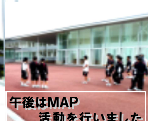
午後はMAP活動を行いました