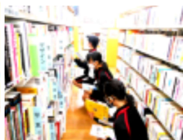
この他の生徒の活動の様子等は学年便りや学年PTAの際にお伝えいたします。