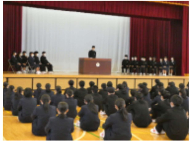
全校生徒の前で新生徒会へ引き継ぎ