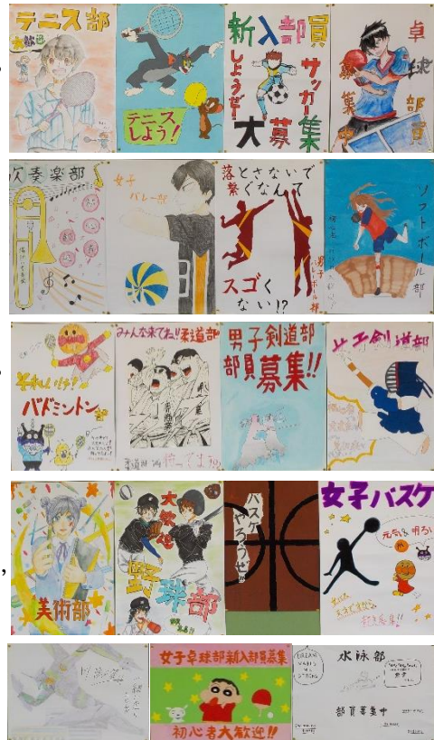
部活動ポスターは1年廊下と昇降口に掲示

カプセルを切り離れた「はやぶさ2」は、2026年には小惑星「2001 CC21」の近くを通過して観測し、2031年には最終目標の小惑星「1998 KY26」に到着する予定とのこと。