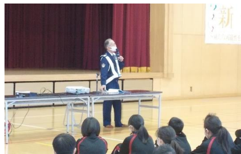
警察署員の方の講話を真剣に聴きました。

4月19日(月)、大河原警察署交通課の方を講師にお招きし、自転車安全教室を実施しました。講師の先生からは「自転車安全五則(下記)」を守って事故防止に努めようという講話をいただきました。