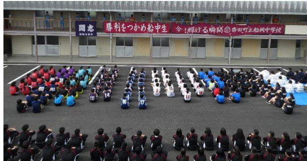
激励会を、部室棟と校舎の間にある駐車場で行いました。決意表明も激励のメッセージもみんなの心に響きました。