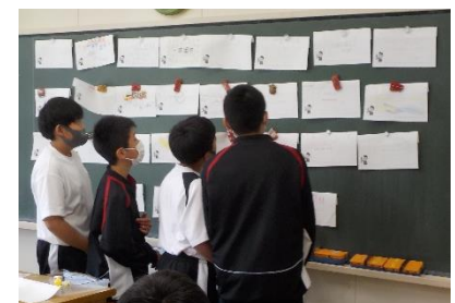
学級活動の様子(一人一人が作成したクラス目標のデザインを、小グループで見ているところです。)