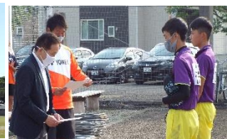
郡中総体での一コマ(ソフトテニス会場にて)