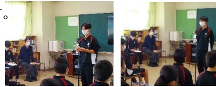
放送による新人大会報告会。今後に向けた意気込みも話してくれました。