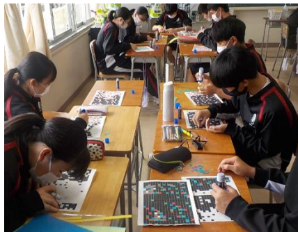
文化祭の全校制作に向け、各クラス、真剣に取り組んでいます。今年度は何ができるのか、今からとても楽しみです。