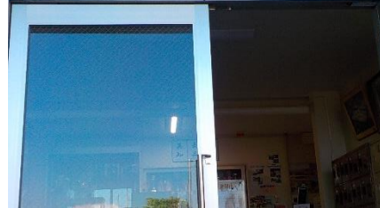
地区新人大会の成績を玄関窓に掲示