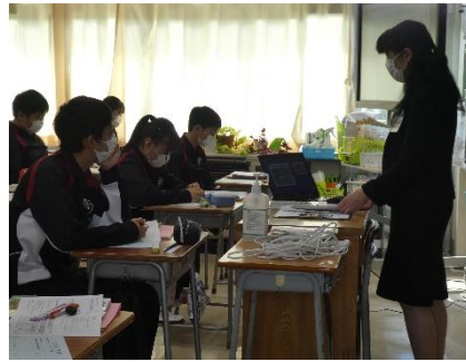
(3年10/21・22)保育講話。園児の様子を動画で見ながら、その特徴について保健師の方から講話をいただきました。

右の写真のような形態で行いました。身の回りの生活の中に潜んでる危険、気づかぬうちに巻き込まれているかもしれないトラブルなど、安心安全な日常生活を送るためには、さまざまなことに注意する必要があることを学びました。