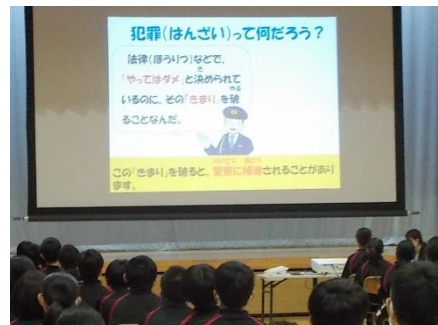
(1年10/25)防犯教室。警察の方から、情報モラル、未成年者の犯罪、不審者対策等についての講話をいただきました。