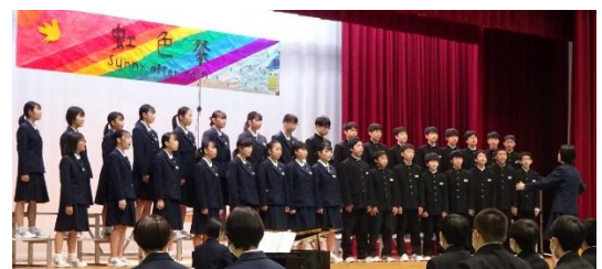
10/16 合唱コンクール。2学年各クラスの1コマです。(上段左1組、同右2組、下段左3組、同右4組)