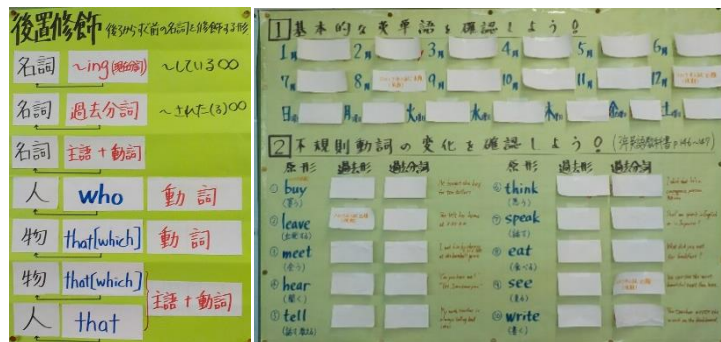
英語学習の掲示物(3年廊下)「後置修飾」という後ろからすぐ前の名詞を修飾する形の文法事項や「月名や曜日の英単語や不規則動詞の変化」を確認する掲示物です。すき間時間を活用するきっかけに。