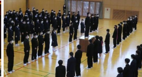
生徒会引継式(11/9(火))生徒会役員(写真左)と応援団幹部(同右)の引継式を行いました。船岡中学校の伝統が引き継がれ、新たな1ページが始まります。これまで先頭に立って引っ張ってきた皆さんの思いと新メンバーの決意が伝わってきた引継式でした。