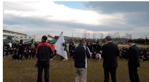
火災想定避難訓練(11/15(月))移動、整列、点呼、検索、すべて確実に実施できました。事前学習プリントでは、火災に対する防災知識として、「煙が命を奪う」というテーマで、一酸化炭素の怖さ、煙から逃げるための方法などについて学びました。火災発生が多いシーズンになります。いつでも火の用心を。