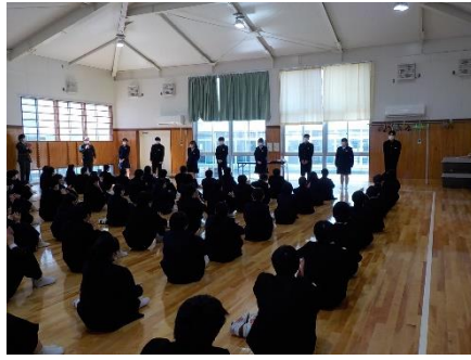
同窓会入会式(3年) 3年生141名が新たな会員となりました。(式は、距離を確保し、10分程度で終了しました。)

3月1日(火)に、同窓会入会式を実施しました。感染症対策を講じて、短時間で、新入会者代表の挨拶や記念品の贈呈、世話人の紹介を行いました。75年の歴史と17,200余名の卒業生を持つ伝統ある学校の同窓会の一員になり、また一つ大人に近づいた雰囲気を感じました。