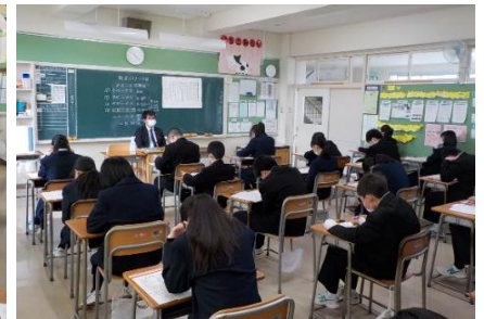
(1,2年)期末考査 今年度最後の期末考査。真剣に取り組んでいました。2/24~25