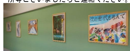
しばたの郷土館出展作品 美術室前廊下に5つの作品を掲示しています。