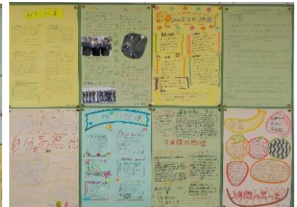
(3年)「船中3年間の思い出」 3年生一人一人が中学3年間の思い出を1枚にまとめました。レイアウト、話題の絞り込み、テーマ性、仲間への感謝の言葉など、「さすが3年生」と思わずにはいられない作品集です。