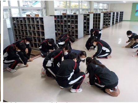
清掃強化日 清掃時間を10分間延長し、床みがき、窓ふきなどを入念に行っています。(写真は生徒昇降口)