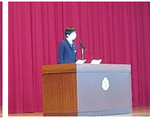
修了証授与及び代表生徒所感発表 各クラスの代表生徒に修了証を授与しました。また、各学年2名の代表生徒が、今年度を振り返り来年度にける意気込みを堂々と発表しました。(2年)