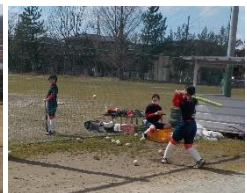
部活動再開 3月22日(火)に部活動を再開。生徒一人一人が躍動しています。