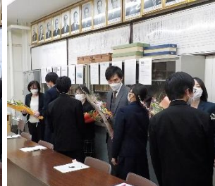
離任式(29日)(校長室からのリモート) 生徒会長さんから生徒代表感謝の言葉がありました。お別れする先生方への熱い気持ちが伝わってきました。